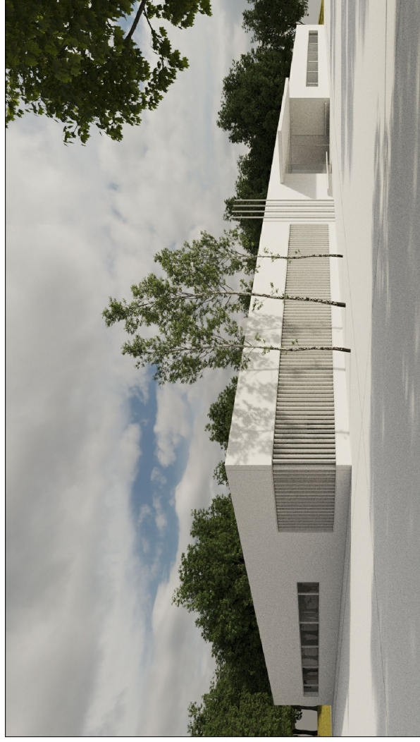
estudio volumetria exterior 2

(avance imagen del render modelado 3d) proximamente se adjuntará ampliación render