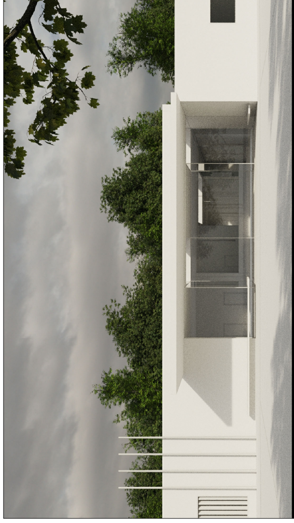
estudio volumetrico acceso principal

(avance imagen del render modelado 3d) proximamente se adjuntará ampliación render